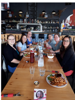
L'équipe sages-femmes, juillet 2019

C'est avec plaisir que nous vous annonçons que cette levée de fonds Grilled cheese a permis d'amasser la somme de 1 900 $. Un grand merci aux organisateurs!