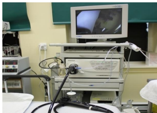
Contribution à l'achat d'un 2 e colonoscope (25 000 $). Permet de réaliser 400 examens par année au lieu de 128 avec un seul appareil. Permet de diminuer la liste d'attente.