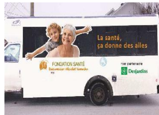
Autobus adapté (12 000 $) pour les résidents qui vont passer des examens médicaux.