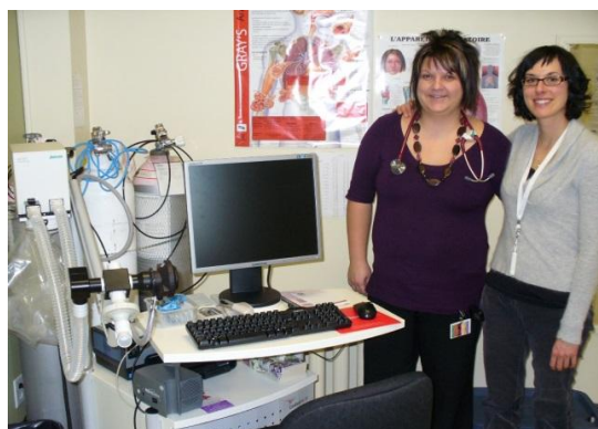
Ajout de service sur notre territoire : unité satellite en pneumologie (20 000 $). Plus de 500 consultations par an chez nous.