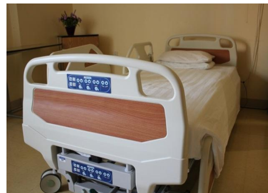
Achats de 25 lits électriques (95 000 $) pour les résidents des 5 centres d'hébergement. Tous les résidents ont un lit électrique.