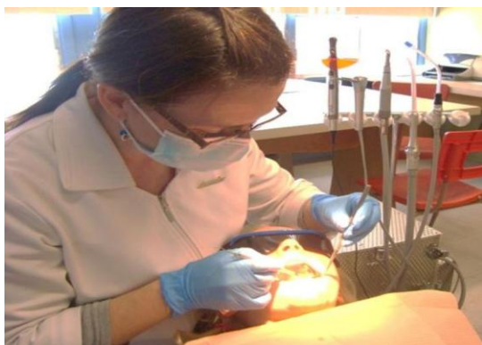
Achat d'un 2 e équipement portatif dentaire utilisé dans les écoles (12 000 $). Plus de services dans les écoles pour nos enfants.

Voici à quoi servent vos dons. Vous constaterez, à partir de ces quelques exemples de nos investissements des dernières années, que nous tentons de rejoindre les besoins de santé de toute la population, que ce soit en termes d'âge, de localisation géographique, ou de type de services.